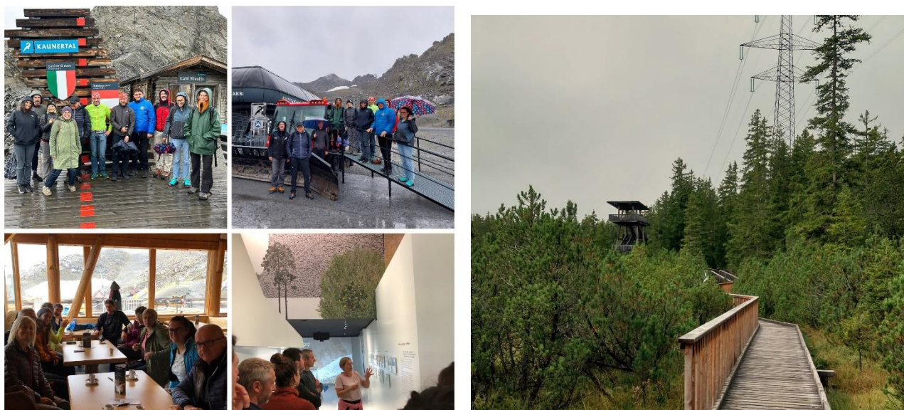
Figura 2 - Fotografie delle Study visit in Austria.

Infine l'ultimo giorno i GAL presenti nella study visit hanno avuto la possibilità di visitare il Parco Naturale Kaunergrat, sito lungo la pista ciclabile via Claudia Austa, dove il Direttore del Parco, Ernst Partl, ha descritto le varie aree del sito inclusive e senza barriere, tra cui il punto di osservazione accessibile e il "Naturdenkmal Piller Moor", percorso inclusivo nel parco e 3 volte vincitore del 1° premio per l'accessibilità. In particolare i premi vinti sono: il Premio EDEN 2013 - Premio della Commissione europea per le destinazioni turistiche sostenibili, il Tirol Turistica 2013 - uno dei più alti