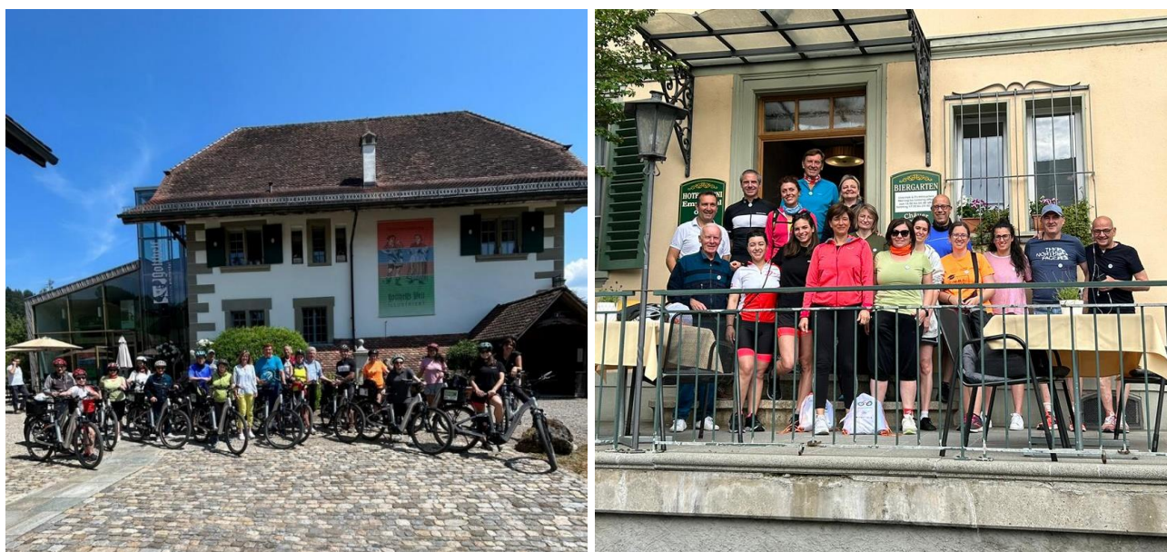
Figura 1 - Fotografie della Study visit in Svizzera.

Importante momento di scambio di buone pratiche, la study visit proposta dai GAL ha visto il coinvolgimento di rappresentanti delle amministrazioni e degli enti di promozione turistica locali, che nei tre giorni alla scoperta della regione dell'Emmental hanno avuto modo di incontrare promotori e gestori delle ciclovie Herzroute e Hügu Himu, e delegati di Emmental Tourismus, ente di pianificazione e promozione turistica. Herzroute, letteralmente la Ciclovie del Cuore, è un percorso lungo 720 km, che collega il Lago di Costanza al Lago di Ginevra e che nel 2023 ha festeggiato il suo ventesimo anniversario. Esempio virtuoso di governance multilivello, nella sua gestione vengono coinvolte le autorità svizzere a tutte le scale: federale, di Cantone e comunale, oltre che i singoli privati. La Società Herzroute, in stretta collaborazione con l'ente di promozione turistica Emmental Tourismus, si occupa infine della segnaletica, della manutenzione e della promozione del percorso e delle strutture e dei servizi a essa affiliate: noleggio di bici, alberghi e aziende agricole. Per arricchire ulteriormente l'offerta è stata creata nel 2021 una rete di percorsi ad anello addizionali, promossi con il concept Hügu Himu, la "collina del cielo", che consentono di valorizzare i beni culturali, i paesaggi e i prodotti tipici attraverso il reticolo di strade rurali non trafficate. Questa esperienza è stata un esempio virtuoso che ci ha ispirati per il progetto di cooperazione Orobikeando 2.0.